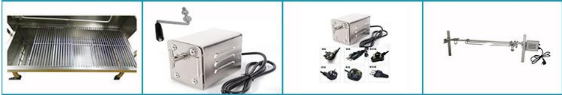
BBQ66电动/手动转动烧烤机