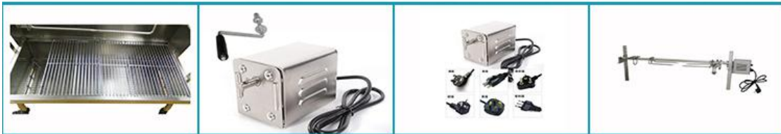
BBQ118电动/手动转动烧烤机