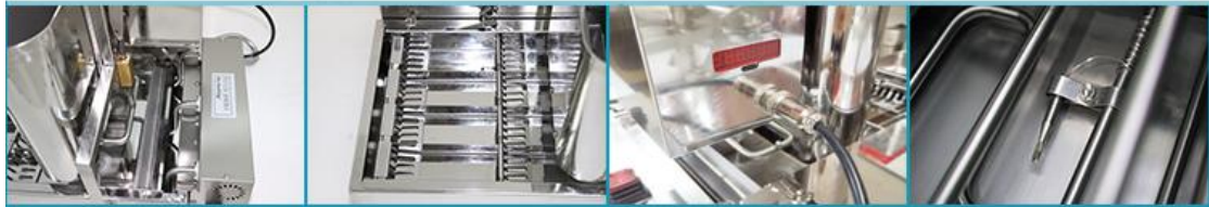
LBD4四排迷你自动甜甜圈机(机械)